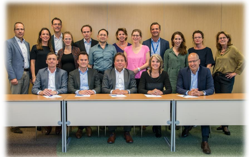
Fig. 3 Bestuurlijk overleg

Het Regionaal Oncologienetwerk Midden Nederland is een ambitieus oncologisch netwerk voor trefzekere oncologie, waarin zorgprofessionals van verschillende ziekenhuizen in gespecialiseerde expertteams samenwerken aan de beste patiëntenzorg, wetenschappelijk onderzoek en kennisdeling.